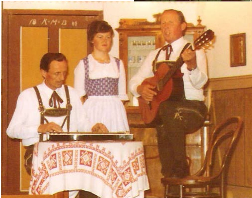
Er hat Glück mit Monika (1978)