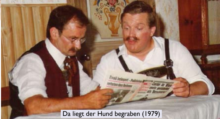
Da liegt der Hund begraben (1979)