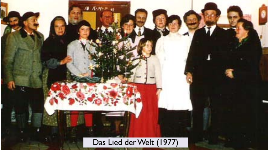
Das Lied der Welt (1977)

Im Jahre 1984 wurde, aus der damaligen Landjugend heraus, unter der Leitung von Rupert Perwein die jetzige Theatergruppe gegründet. Für das Stück „Der Liebeserwecker“ konnte mit Gretl Steiner eine Spielerin aus der alten Theatergruppe für die Regie gewonnen werden. Der große Erfolg der Aufführungen ermutigte dazu, auch weiterhin Theater zu spielen.