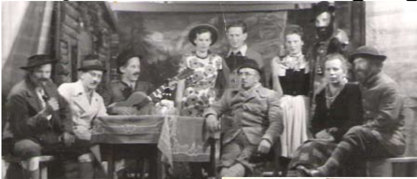
Verlobung auf der Alm (1953)